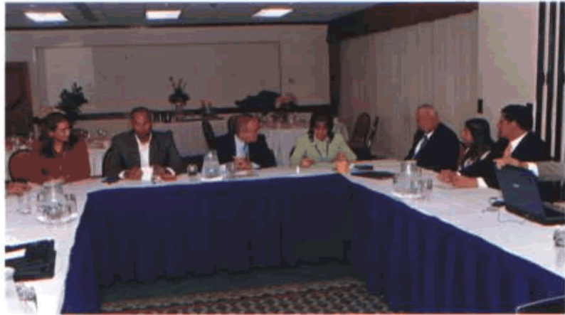
CELAES XXI 1-2y3 OCT 2006