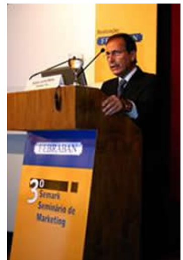
En este sentido, FEBRABAN y las entidades de defensa del consumidor vienen realizando

percepción de que la empresa es socialmente y/o ambientalmente responsable. “La preocupación socio ambiental debe ser el meollo de la empresa”, concluyó. En el Seminario de Atención Bancaria , fueron discutidos las conquistas y los desafíos de los bancos en la aplicación del código de defensa del consumidor. “Bancos, clientes y entidades de defensa del consumidor tienen que, cada vez mas, ponerse unos en los lugares de los otros”, dijo el consultor Elói Zanetti. Para él, en los últimos años, hubo una mejoría en la atención al público por parte de los bancos, pero es preciso buscar, con insistencia, una manera más sencilla de