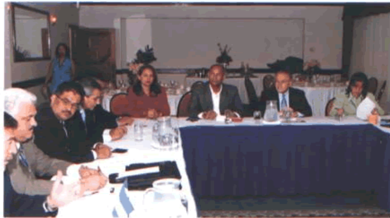
CELAES XXI 1-2y3 OCT 2006