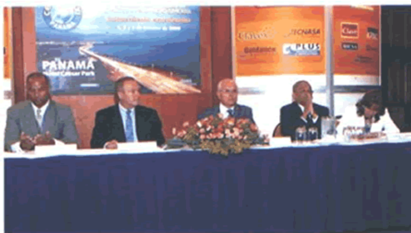
CELAES XXI 1-2y3 OCT 2006