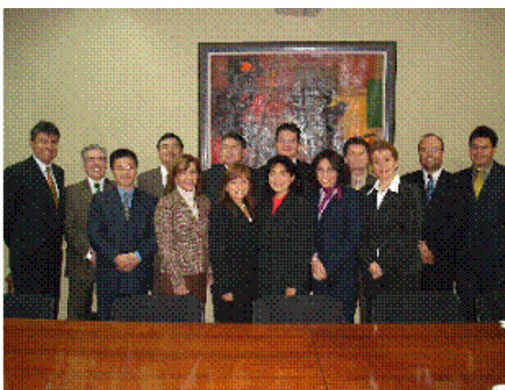
Reunión de Comité Técnico Bancared y Administradores SWIFT de bancos participantes de BSB. Oficialización de inicio de operaciones BSB.