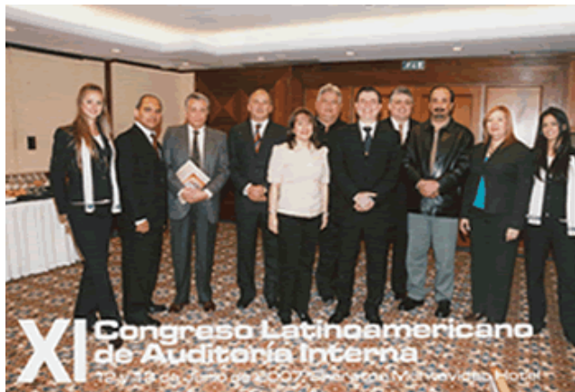
Miembros del Comité CLAIN

Desde ya los invitamos a participar en el próximo XII Congreso CLAIN 2008, el cual se realizará en la Ciudad de Sao Paulo, Brasil.