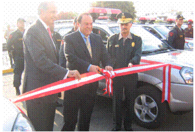
Ismael Benavides, ex-presidente de ASBANC, realiza entrega de equipos a Luis Alva Castro, Ministro del Interior.

La donación consistió en 18 camionetas y 34 motocicletas, equipados con sistemas de luz, sonido y comunicaciones, incluyendo equipos GPS en el caso de las camionetas. Las referidas unidades serán destinadas a la ciudad de Lima, así como a otras ocho ciudades del interior del país. También se hizo entrega de 194 chalecos